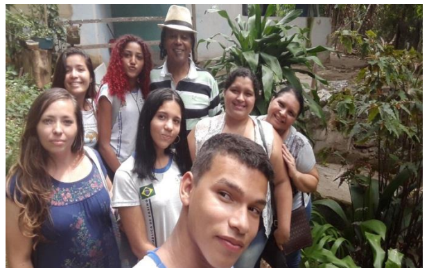
Figura 1 - Alunos com o líder Quilombola.

Alunos do 1º ano do ensino Médio, do CIEP 313 – Rubem Braga, de Senador Camará, uma das escolas contempladas com o projeto PIBID (Programa institucional com bolsa a iniciação a docência), tiveram a possibilidade de vivenciar, no dia 20 de outubro de 2017, uma experiência marcante em suas vidas, com uma visita aula ao Quilombo de Sacopã, na zona sul da cidade do Rio de Janeiro.