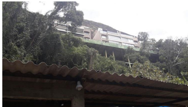
Figura 2 - Edifício de alto padrão, construído em terras quilombolas.

Situado próximo ao Parque Natural Municipal da Catacumba, num dos mts 2 mais caros da cidade do Rio de Janeiro, no bairro da Lagoa Rodrigo de Freitas, cercados por prédios luxuosos e pela alta elite carioca, o Quilombo de Sacopã tornou-se um símbolo de resistência ao seu espaço de direito.