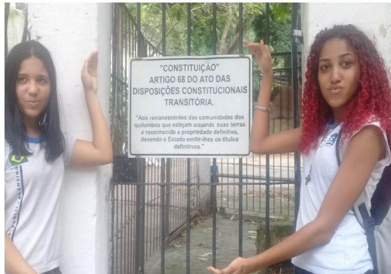
Figura 3 Alunas mostrando a placa do Artigo 68 da constituição.

desembargadores do Estado do Rio de Janeiro, que se sentem “incomodados” com a presença dos quilombolas num dos cartões postais mais lindos da cidade maravilhosa.