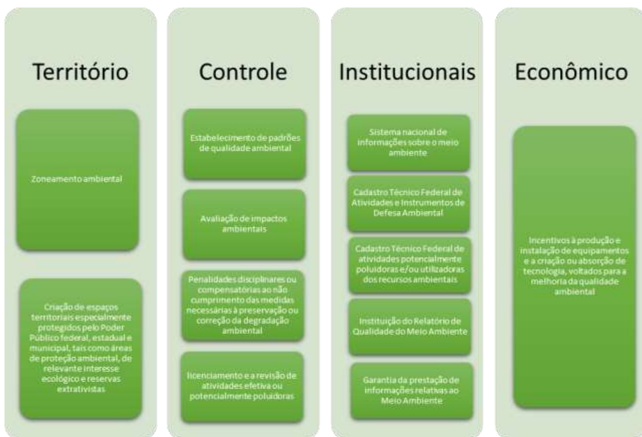
Figura 3 – Instrumentos na Política Nacional de Meio Ambiente

Considerando o que entendemos na listagem de objetivos e o quanto eles contribuem para os instrumentos, a figura 3 apresenta todas as formas que a lei entendeu que seriam importantes para atingir os seus objetivos.