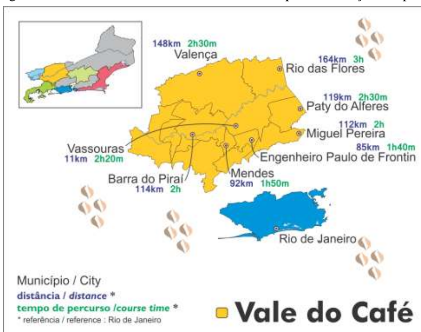
Imagem 3 – Região Vale do Café e a distância dos seus municípios em relação a capital fluminense

Na política de regionalização implementada pela Setur e TurisRio (2014), os dois órgãos responsáveis pela política estadual de turismo, o Vale do Café compreende os municípios de Paty do Alferes, Volta Redonda, Piraí, Barra do Piraí, Miguel Pereira, Paracambi, Mendes, Paraíba do Sul, Barra Mansa, Engenheiro Paulo de Frontin, Pinheiral, Rio das Flores, Valença e Vassouras. Nas linhas abaixo, destacaremos os municípios que estão na vanguarda do turismo regional e que apresentam um arranjo turístico local minimamente organizado e com boa visibilidade. Abaixo, está o mapa do turismo fluminense: